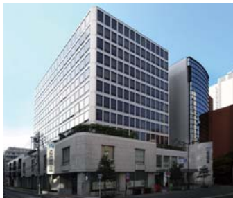
大阪市信用金庫 本店

●城東ローンセンター 〒536-0004 大阪市城東区今福西1-9-6 城東支店5階 TEL.(06)6939-5331